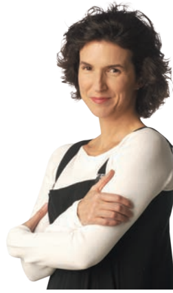
DOMINIQUE LEMIEUX CONCEPTRICE DES COSTUMES