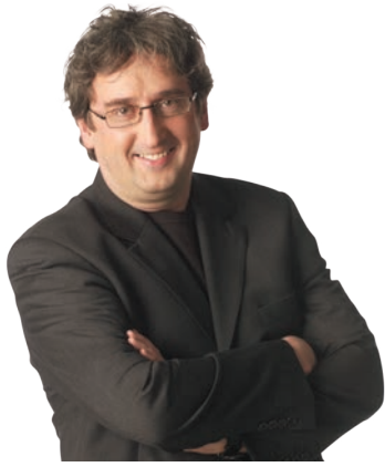
JEAN RABASSE SCÉNOGRAPHE